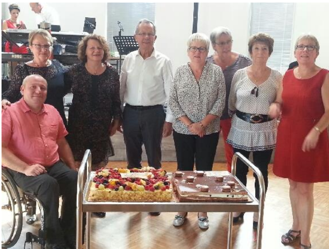
Les membres du CCAS

Les participants ont apprécié le succulent repas concocté par le traiteur et passé un très bel après-midi. Les élus et les membres du CCAS de la commune ont mis tout en œuvre pour la réussite de cette manifestation.